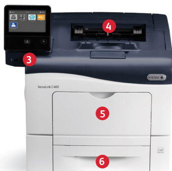
Imprimante couleur Xerox® VersaLink® C400 Impression.