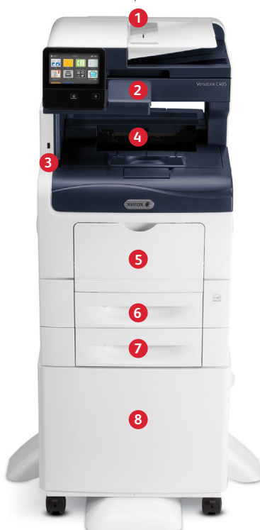
Imprimante multifonctions couleur Xerox® VersaLink® C405 Impression. Copie. Numérisation. Télécopie. Courriel électronique.