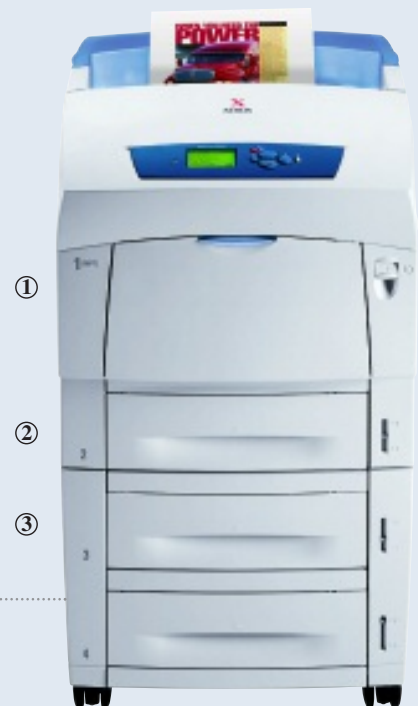
Imprimante couleur Phaser 6250DX

Une option rapide d'impression recto-verso vous permet de faire des économies (en standard sur les configurations DP, DT et DX).